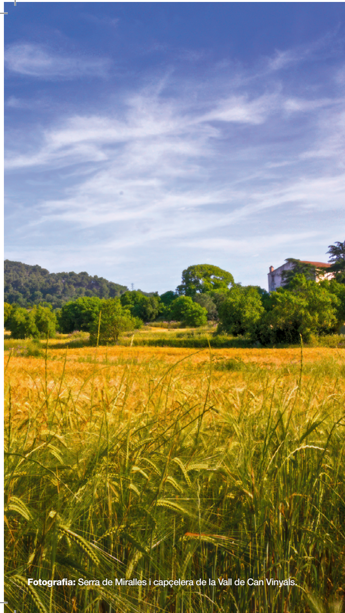
Fotografia: Serra de Miralles i capçelera de la Vall de Can Vinyals.