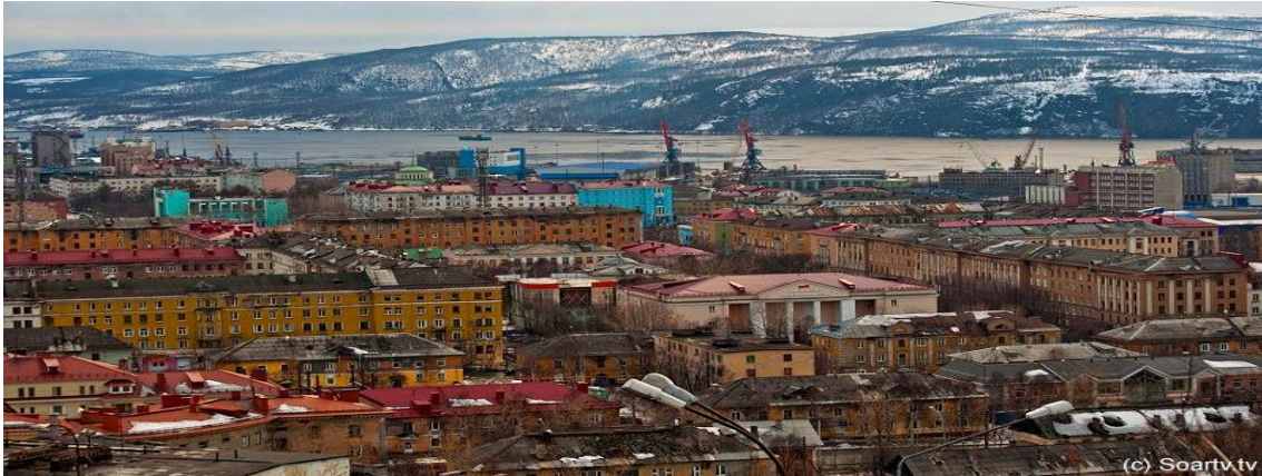
Murmansk, ciudad histórica a orillas del Mar de Barents

Salida de Barcelona a la hora convenida para tomar el vuelo a Moscú. Enlace con el vuelo a la histórica ciudad portuaria de Murmansk, situada en un profundo golfo a 35 km. de las orillas del Mar de Barents. A la llegada, traslado del aeropuerto al Hotel Azimut. Cena en restaurante. Alojamiento en hotel.