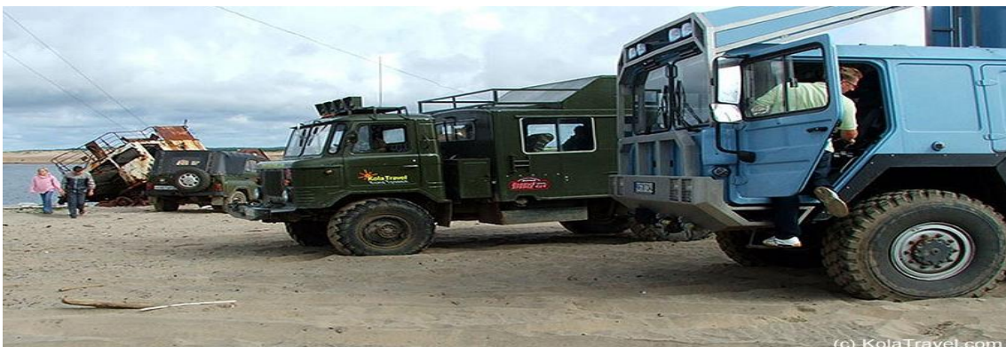
Camiones todo terreno para explorar la Península de Kola

Desayuno. A las 9:00 am traslado a Monchegorsk. Reunión con el guía local que nos explicará el programa de hoy. Iniciaremos nuestra ruta en un camión todoterreno. Fuera de cualquier carretera nos dirigiremos a las montañas Khibiny. Comeremos en la ciudad de Kirovsk durante el trayecto. Seguiremos hasta el paso Kukisvumchorr, a la vez que nos detendremos en varios lugares para hacer fotos panorámicas del paisaje. Iniciaremos después una pequeña caminata a las cascadas próximas. Luego alcanzaremos un pequeño glaciar que nunca se derrite, ni tan solo en verano. Llegaremos al lugar de pernocta, un acogedor hotel de montaña para pasar la noche. Disponibilidad de sauna. Cena. Alojamiento en hotel de montaña.