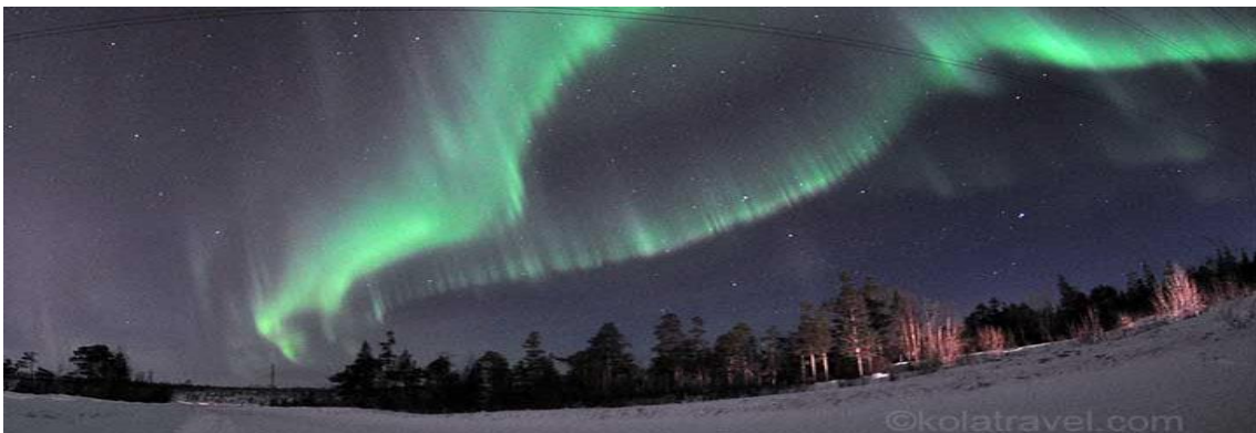
La Península de Kola es un excelente emplazamiento para la observación de Auroras Polares

Desayuno. Con el equipaje preparado, efectuaremos el traslado al aeropuerto. Vuelos a Moscú y Barcelona. Fin del viaje-expedición.