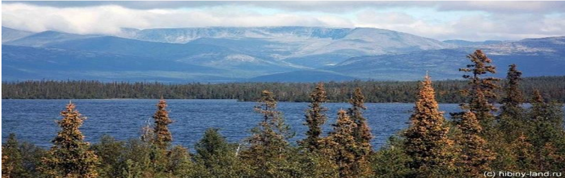
El mayor lago de la Península de Kola: el lago Imandra

Desayuno. Hoy vamos a explorar el lago más grande de la península de Kola, que nos abrirá sus imponentes paisajes, mezcla de tundra y taiga en completa armonía. En la orilla del lago recibiremos instrucciones de nuestro guía para utilizar las embarcaciones. Iniciada la navegación cruzaremos el paso elevado a través del embalse, siguiendo a largo del pasaje Kilevay desembocando en el Gran Lago Imandra. Nuestra navegación seguirá a lo largo de la costa entre pintorescas islas. La comida se realizará en el desierto ártico, en una de las hermosas islas. Después del almuerzo iniciaremos el camino de regreso con nuestras embarcaciones. Traslado al hotel en Murmansk. Cena en el hotel.