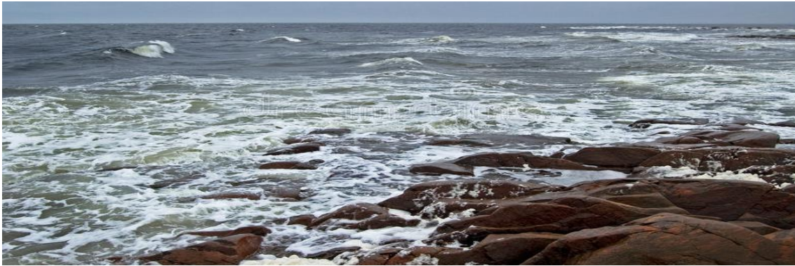
La soledad del Mar Blanco invita a soñar con el mundo Ártico

Desayuno. Continuaremos nuestro viaje a lo largo de la costa del Mar Blanco. Primero, por una carretera de asfalto, siguiendo la marea baja. Nuestro primer objetivo es una réplica del antiguo lugar habitado por gentes de mar llamado Tetrina Tonya, un verdadero museo al aire libre. Tetrina Tonya nos muestra el estilo de vida real de los habitantes del mar o Pomory, transportándonos al pasado. Después de la excursión tendremos una comida tradicional al estilo tradicional de los Pomory. Tras la comida seguiremos nuestro camino conduciendo por paisajes solitarios, de gran belleza natural a lo largo de la costa del Mar Blanco. En el camino veremos el antiguo pueblo de Kashkarantsy y la Capilla del Monje Desconocido a orillas del mar. Pasaremos la noche en casas de madera en nuestro campo base de Lodochny Ruchey. Podremos disfrutar de una agradable sauna. Cena de fogata. Alojamiento en lodge.