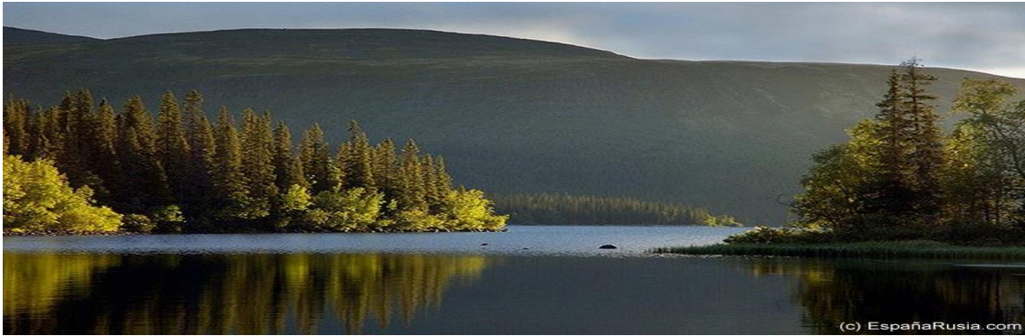
Lagos, bosques de taiga y colinas donde se asienta la tundra en Kola