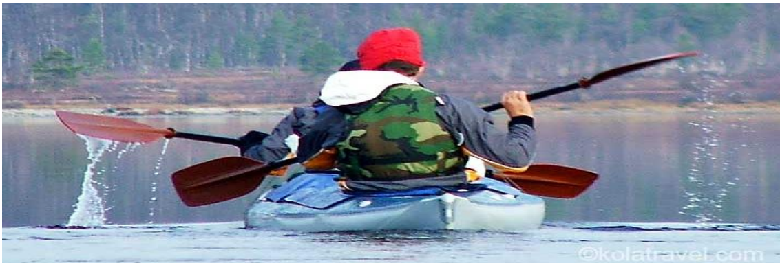
Navegación en kayak en el lago Imandra