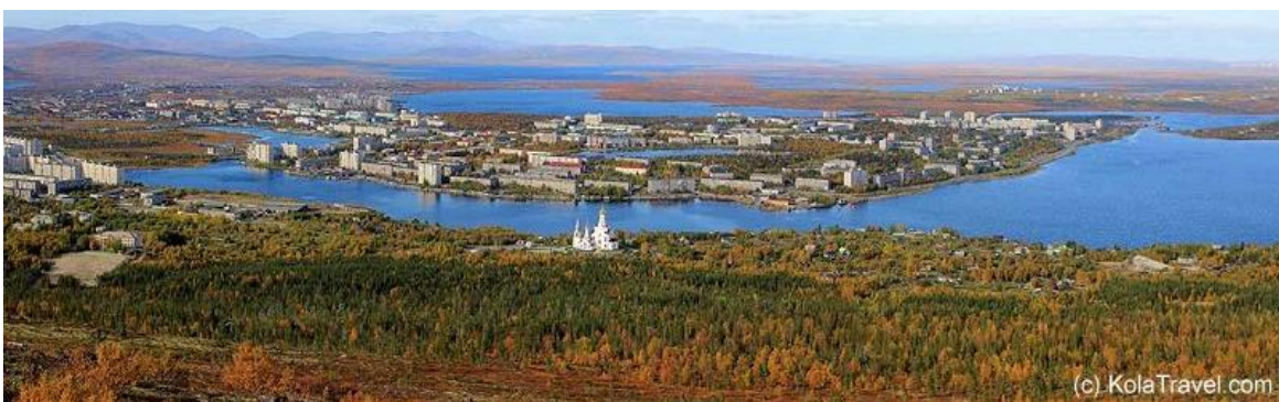
La Península de Kola ofrece regiones lacustres de gran belleza, combinadas con colinas y costas

Desayuno de fogata junto al lago. Continuaremos nuestro camino, siguiendo un sendero que cruza el río Sergevan. Nos detendremos para la comida en el desierto polar, en un entorno de una sutil belleza, donde nos sumergiremos en el ambiente Ártico. Desde el punto final de la ruta de senderismo, iniciaremos el traslado de regreso a Monchegorsk. La longitud de la excursión es de unos 10 km. Cena en restaurante. Noche en hotel.