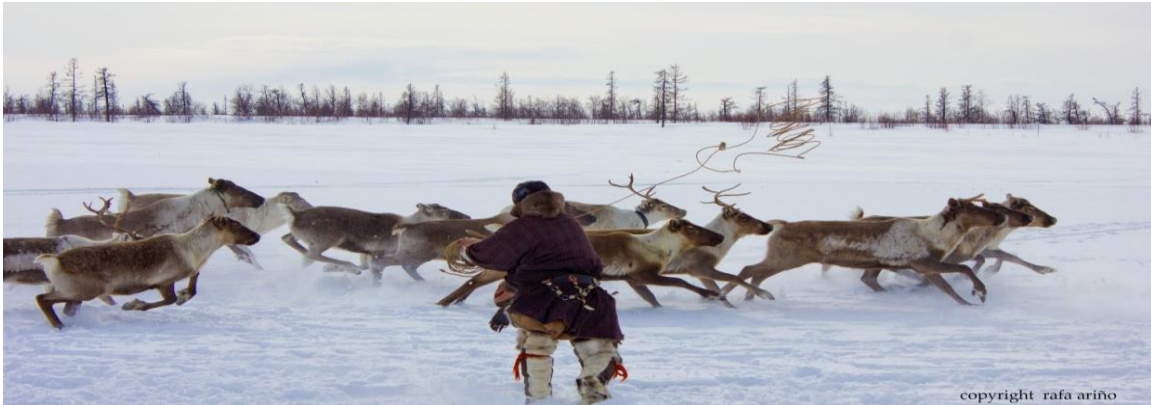
En la Península de Kola abundan los asentamientos saami, pastores de renos

Guerra Mundial. El objetivo de nuestro viaje es el pueblo de Teriberka, fundado en 1523. Teriberka es una mezcla de misticismo, naturaleza salvaje del norte, herencia pre-soviética, soviética y actual. Veremos el pueblo y los lugares donde se filmaron muchas escenas de la famosa película "Leviatán" en 2015. En la orilla podremos realizar observaciones de su peculiar geología, así como de su gran riqueza en flora polar. Caminaremos hasta las cascadas, bajando al mar desde lo alto de los fiordos. Almuerzo en un restaurante. Por la noche regresamos de vuelta a Murmansk. Cena en restaurante. Noche en hotel.