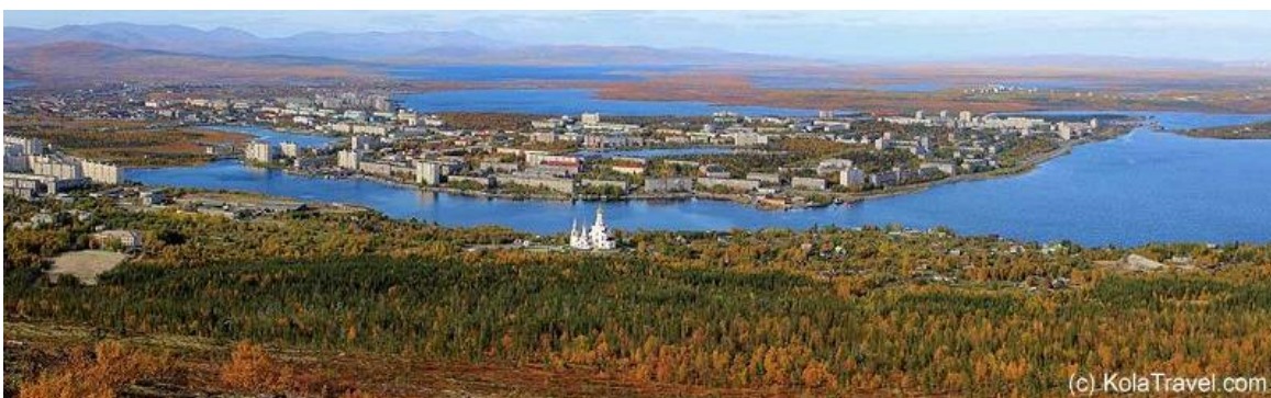
La Península de Kola ofrece regiones lacustres de gran belleza, combinadas con colinas y costas

Desayuno de fogata junto al lago. Continuaremos nuestro camino, siguiendo un sendero que cruza el río Sergevan. Nos detendremos para la comida en el desierto polar, en un entorno de una sutil belleza, donde nos sumergiremos en el ambiente Ártico. Desde el punto final de la ruta de senderismo, iniciaremos el traslado de regreso a Monchegorsk. La longitud de la excursión es de unos 10 km. Cena en restaurante. Noche en hotel.